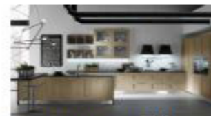
Collección New Ego